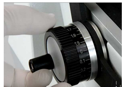
切断サイズ調整ダイヤル