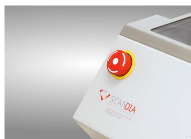
緊急停止ストッパー