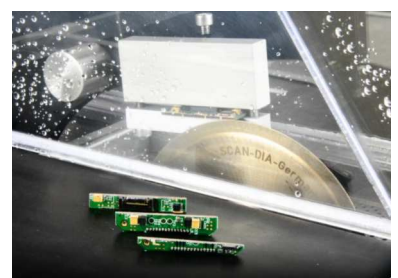
自動カットオフ機能